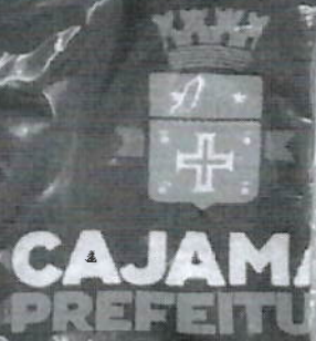
CAMISETA SEM MANGA

H SOUZA COMERCIAL 14.776.040/0001-34 62% POLIESTER 32% VISCOSE 10 FABRILADO BRASIL 12/85