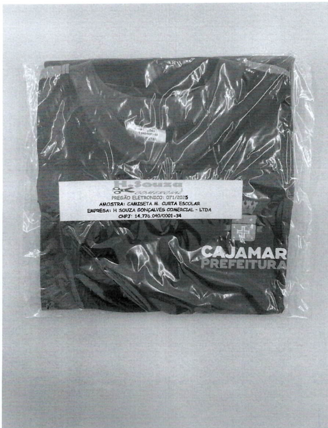
CAMISETA MANGA CURTA