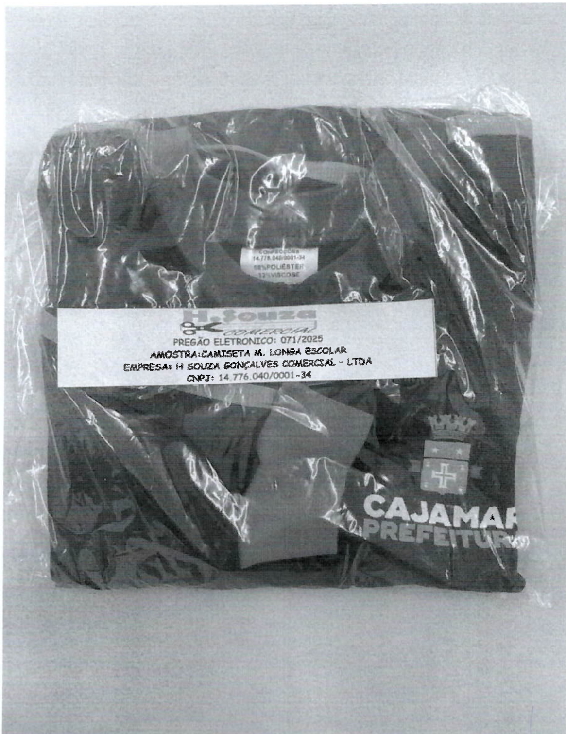
CAMISETA MANGA LONGA

PRAÇA JOSÉ RODRIGUES DO NASCIMENTO, 30 - ÁGUA FRIA - CAJAMAR / SP - CEP 07752-060 / TEL.: 11-4446-0040