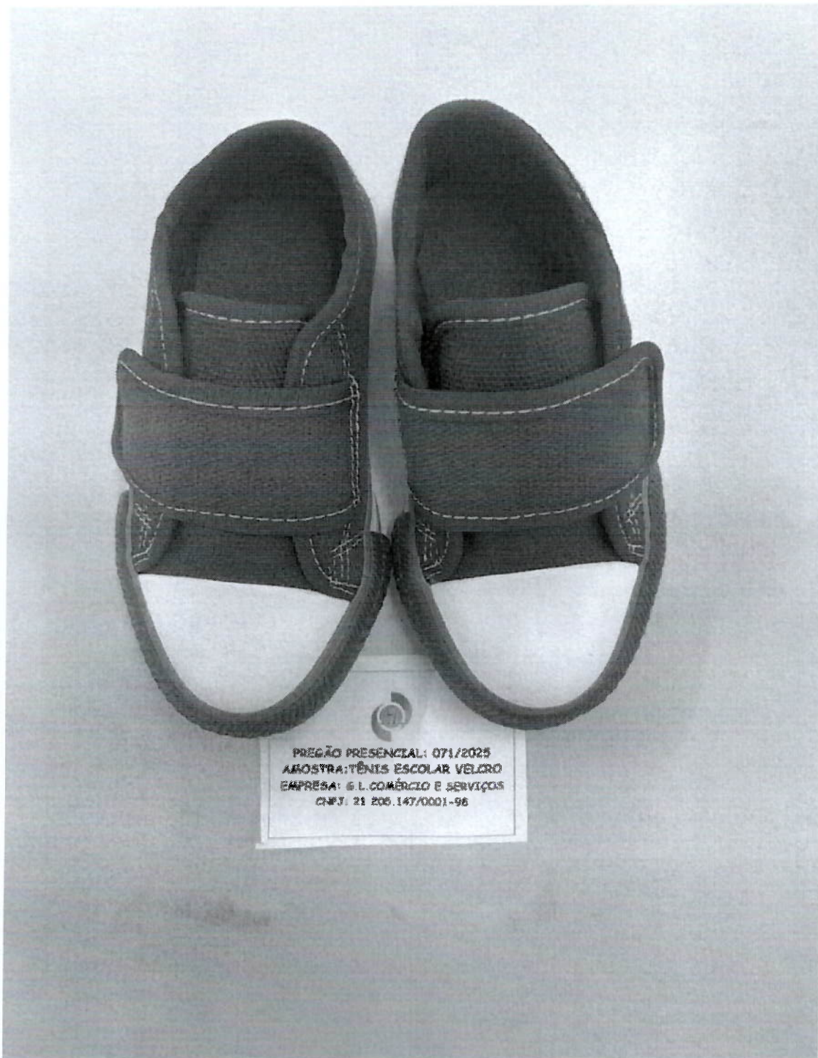
TÊNIS ESCOLAR VELCRO