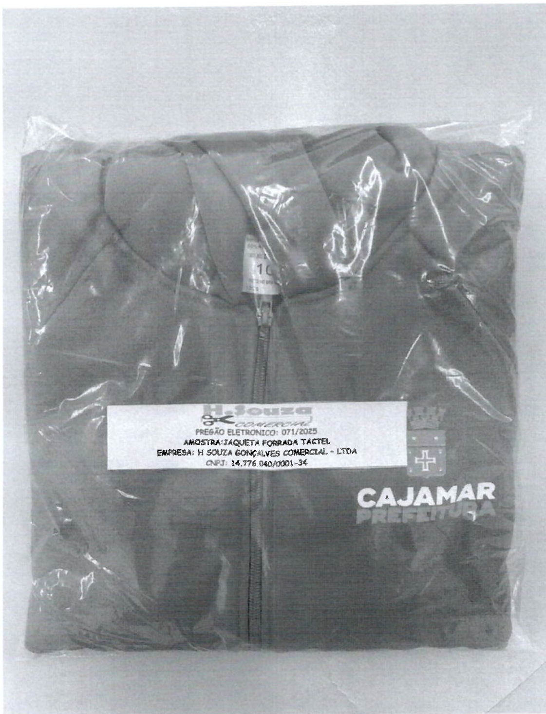
JAQUETA FORRADA TACTEL