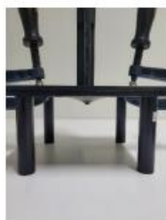
Foto do ensaio

- Com os mesmos sacos testados anteriormente são feitos os demais testes. Nesse teste é apoiado uma ponta perfurante sobre o centro do saco, com uma velocidade de descida inferior a 5 mm/s por um período de 2 minutos. Conforme NBR 14474.