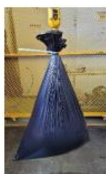
Foto do ensaio

- Nesse ensaio é adicionado determinada peso de acordo com a sua litragem. Logo após é levantado por um período de 2 minutos. É feito esse teste com 8 unidades de amostra.