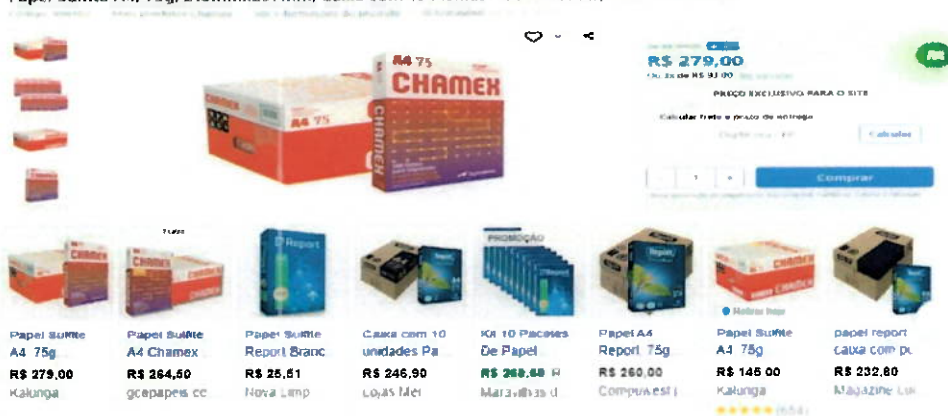
Papel Sulfite A4, 75g, 210mmx297mm, Caixa com 10 resmas - 5000 Folhas, Chamex CX 1 UN

1.7. Para os itens 87, 88, 89 e 90, a administração pode detalhar qual foi o último consumo? Considerando que, o item 87, apresenta o custo inferior ao do fabricante, para o item 88, não apresenta consumo considerado no mercado, já o item 89 como o giro é zero, deixou de ser fabricado, sendo sua fabricação excepcional apenas para distribuidores, pelo fabricante CHAMEX, onde o preço apresentado pela REQUERIDA, também está abaixo do custo do fabricante. Com relação ao item 90, também se trata de um produto de baixo giro e o preço apresentado mantém a característica de estar abaixo do custo do fabricante.