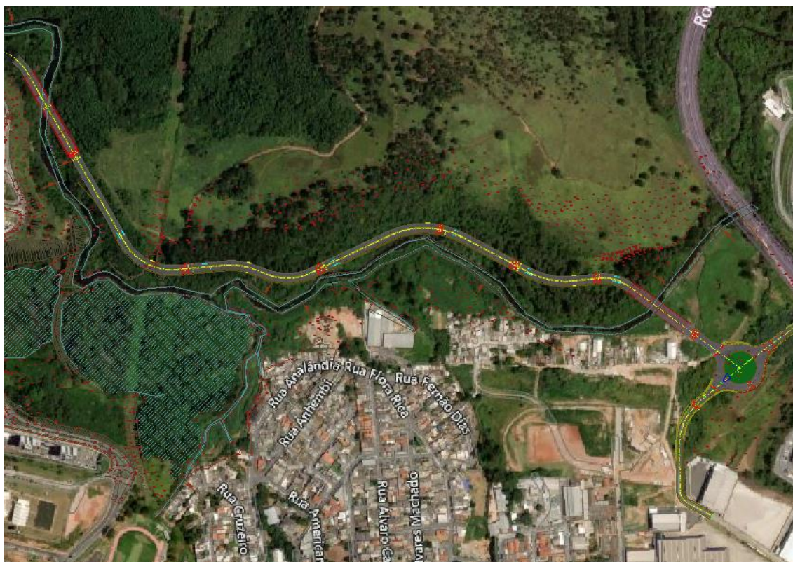
Figura 1 – Imagem aérea do trecho de intervenção da rua a Rua José Marques Ribeiro

O trecho 5 de continuação da interligação Guaturinho, com sentido a Av. José Marques e Rua Padre Luiz Chripim a sofrer intervenção tem 1.172,84 metros de comprimento.