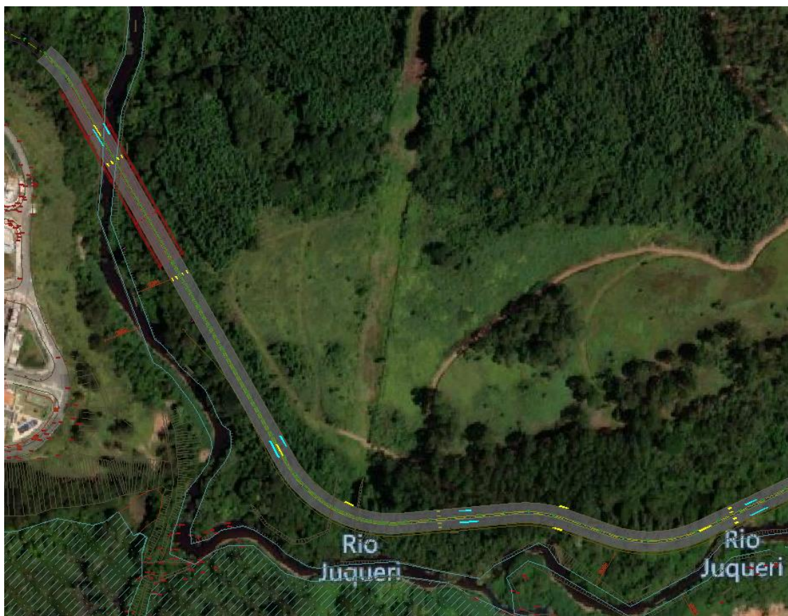
Figura 2 – Características da continuação da duplicação Rua José Marques Ribeiro

O trecho das figuras a seguir da Rua José Marques Ribeiro possui 4 faixas, 2 por sentido de tráfego sendo a pista da esquerda, sentido Av. Tenente Marquês com largura de aproximadamente 7,20 metros, e a pista da direita possui também largura de 7,20 metros. Separadas por canteiro central de 1,90 metros de largura.