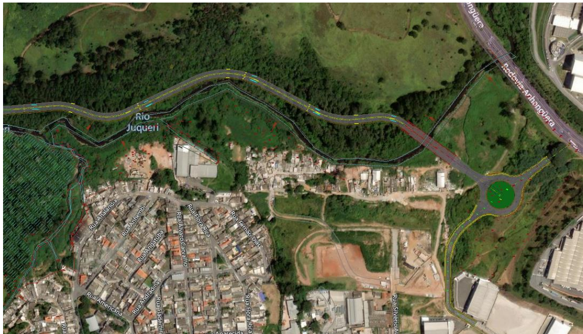
Figura 3 – Características continuação da Rua José Marques Ribeiro

A intervenção nas figuras 2 e 3, representam obras de pavimentação do trecho 4, tendo a implantação de uma rotatória e uma OAE (ponte). Possui 4 faixas (duas com sentido a Rua José Marques Ribeiro e duas com sentido a Rua Luiz Padre Chrispim, antes da rotatória), com largura total de 16,20 metros, tendo as pistas separadas por canteiro central. Já o trecho ao Norte e Sul da rotatória possui 2 faixas, 1 por sentido de tráfego. As pistas são separadas por sinalização. A pavimentação de ruas e avenida de intervenção será em concreto betuminoso usinado a quente (CBUQ) e os passeios de concreto.