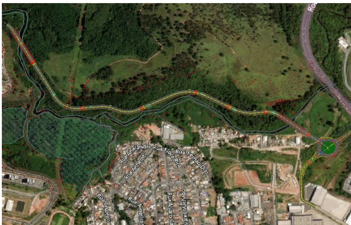
Figura 1 – Imagem aérea do trecho de intervenção da rua a Rua José Marques Ribeiro

O trecho de continuação da interligação Guaturinho, com sentido a Av. José Marques e Rua Padre Luiz Chripim a sofrer intervenção tem 796,90 metros de comprimento.