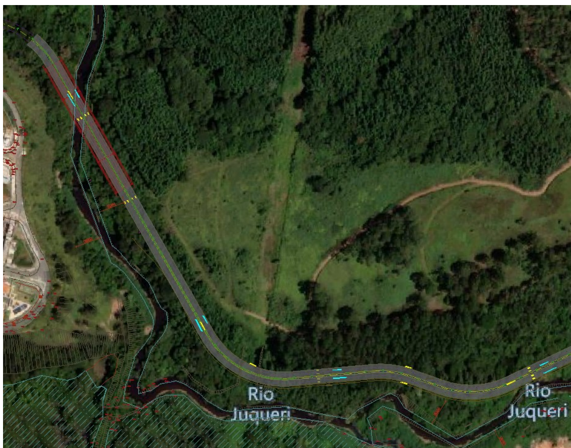
Figura 2 – Características da continuação da duplicação Rua José Marques Ribeiro

O trecho das figuras a seguir da Rua José Marques Ribeiro possui 4 faixas, 2 por sentido de tráfego sendo a pista da esquerda, sentido Av. Tenente Marquês com largura de aproximadamente 7,20 metros, e a pista da direita possui também largura de 7,20 metros. Separadas por canteiro central de 1,90 metros de largura.