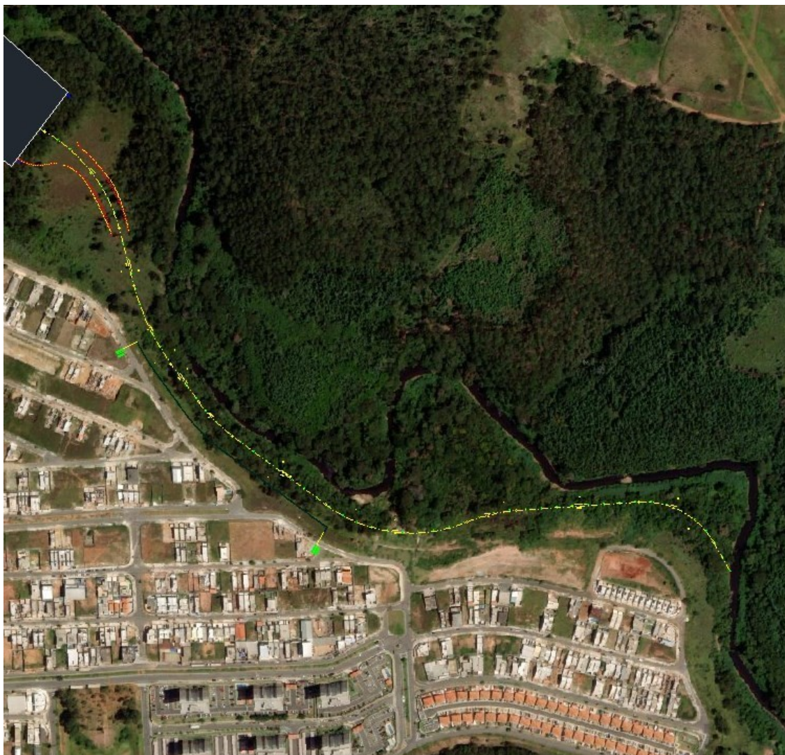
Figura 1 – Imagem aérea do trecho de intervenção que será executado continuando o lote 2 A, passando próximo à Rua Sabrina (2022)

Este trecho da Rua proposta no entroncamento da rotatória, possui 4 faixas com largura total de aproximadamente 16,30 metros, sendo 2 por sentido de tráfego com pavimento flexível. Separadas por canteiro central.