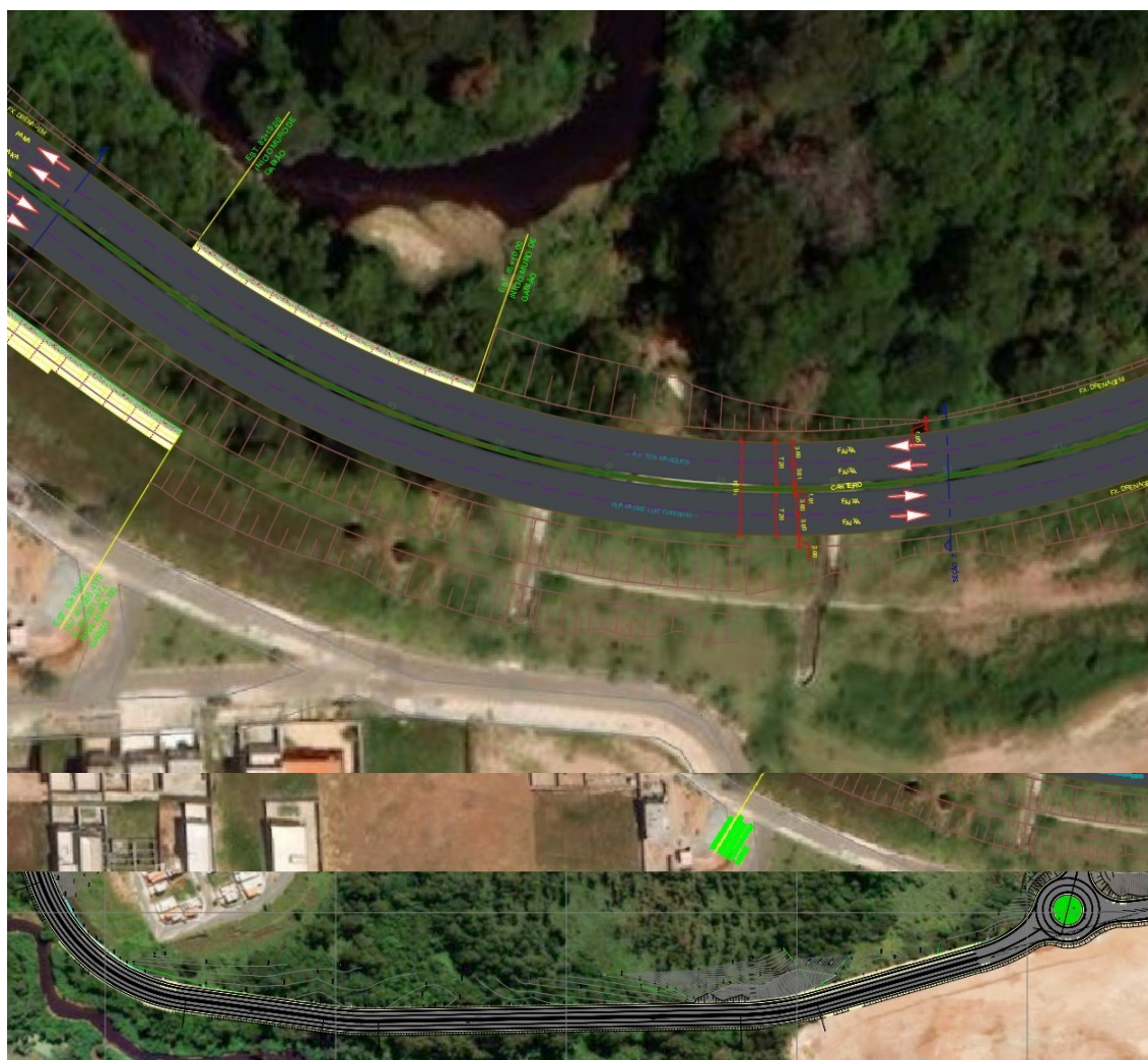
Figura 4 – Características continuação da Rua José Marques Ribeiro