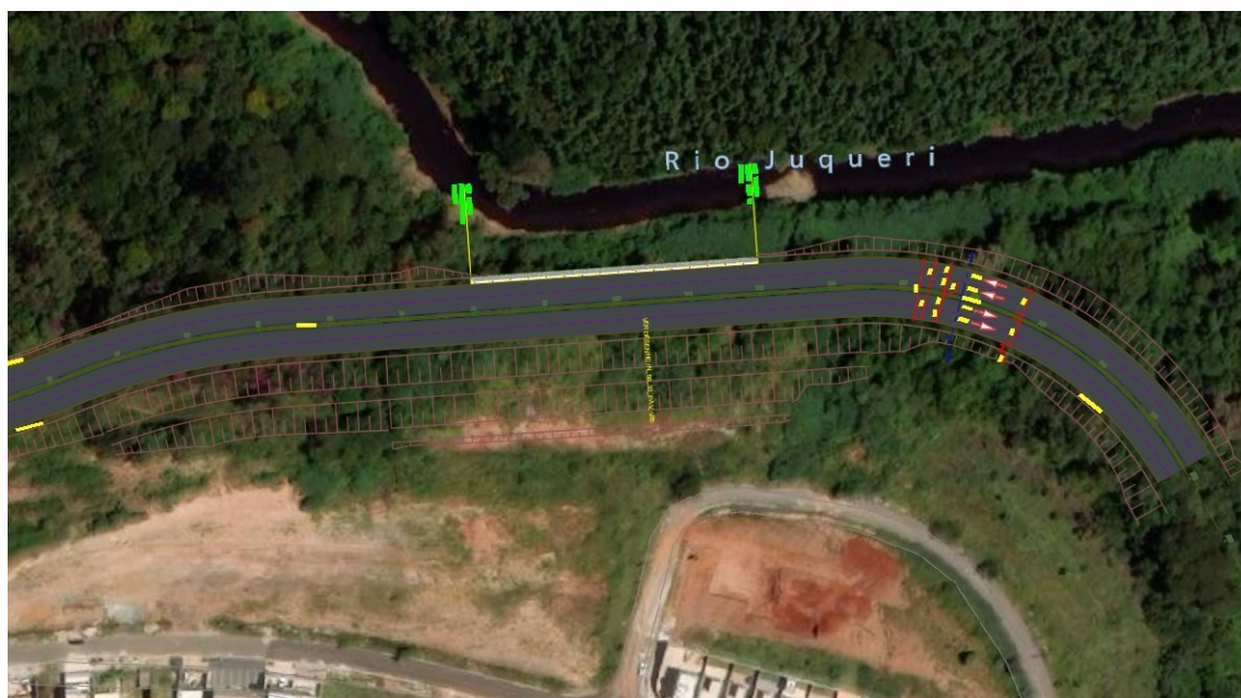
Figura 5 – Características continuação trecho proposto

A pavimentação de ruas e avenida de intervenção será em concreto betuminoso usinado a quente (CBUQ) e os passeios de concreto.