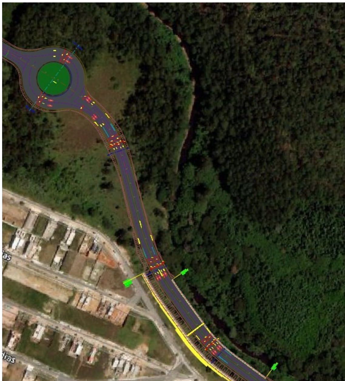
Figura 2 – Características intervenção ao longo do trecho proposto