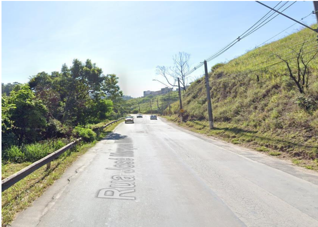
Figura 6 – Características da Rua José Marques – Sentido Avenida Tenente Marques