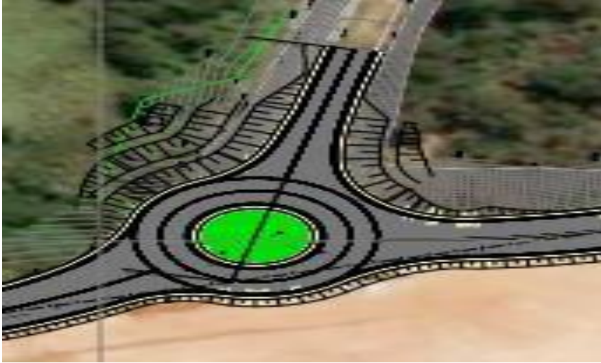
Figura 10 – Características da Av. dos Pinheiros

A pavimentação de ruas e avenida de intervenção será em concreto betuminoso usinado a quente (CBUQ) e os passeios de concreto.