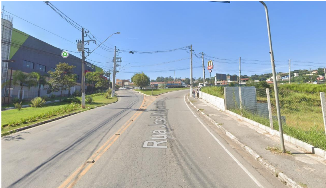
Figura 2 – Características da Rua José Marques Ribeiro – Sentido rotatória da Av. Tenente Marquês

tráfego, tendo aproximadamente 9,10 metros de largura em pavimento flexível. A pista é composta por guia, sarjeta e passeio.