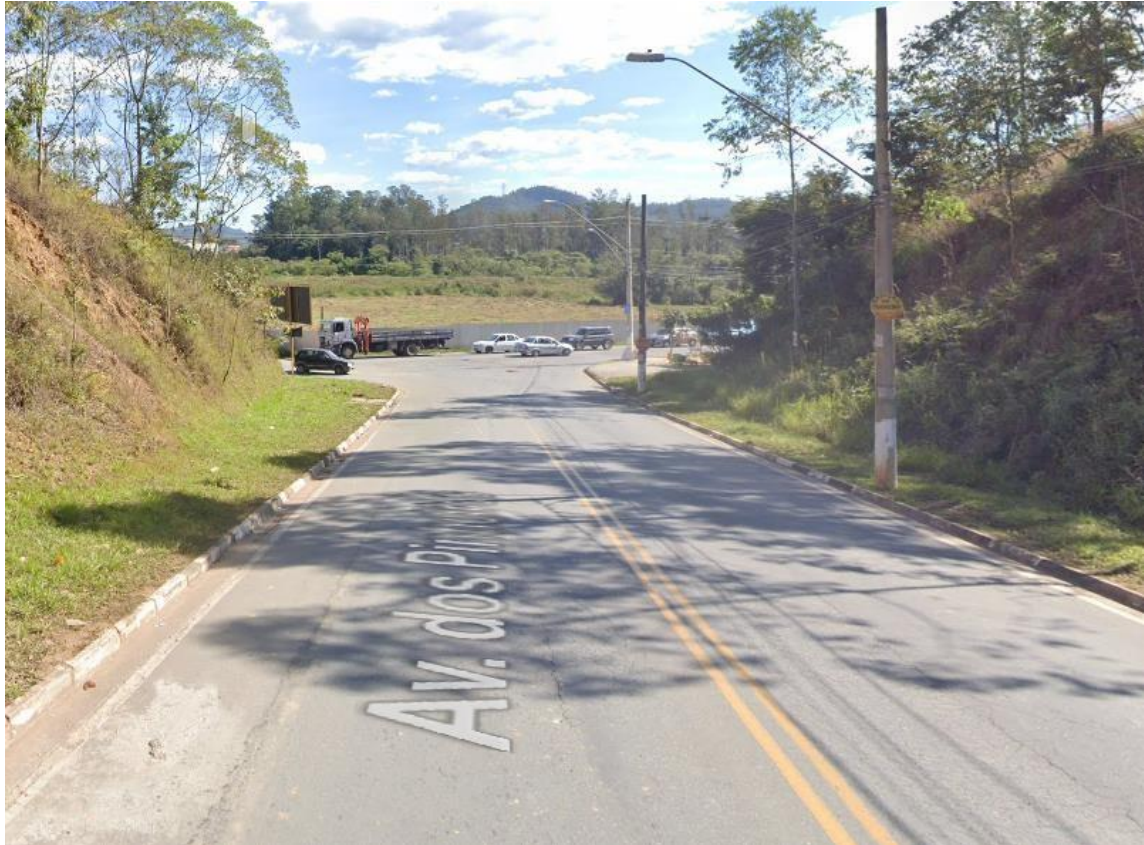
Figura 5 – Características Avenida dos Pinheiros.