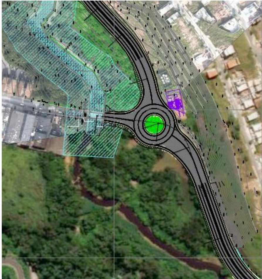
Figura 9 – Características continuação da Rua José Marques Ribeiro

A intervenção representada na figura 10 do entroncamento da Rua José Marques Ribeiro com a Av. dos Pinheiros possui 4 faixas na rotatória, 2 por sentido de tráfego com largura total de 12 metros. Já o trecho ao Leste da rotatória (na Avenida dos Pinheiros) possui 2 faixas , 1 por sentido de tráfego. As pistas são separadas por sinalização.