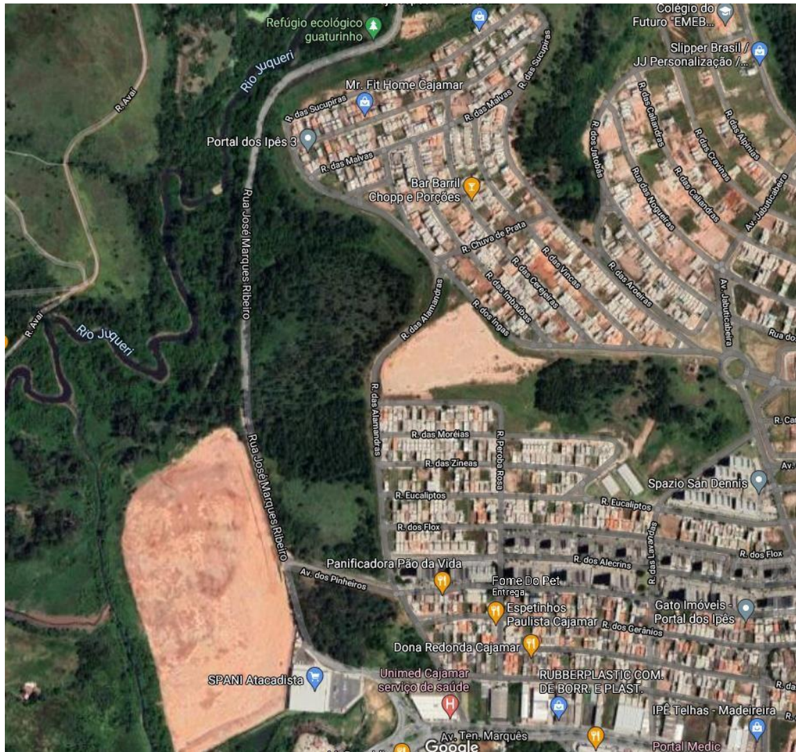
Figura 1 – Imagem aérea do trecho de intervenção da rua a Rua José Marques Ribeiro

Este trecho da Rua José Marques Ribeiro no entroncamento da rotatória, com a Av. Tenente Marquês possui 2 faixas com largura total de aproximadamente 8 metros, sendo 1 por sentido de tráfego com pavimento flexível. Separadas por sinalização. Em todas as pistas a seção é composta por guia, sarjeta e passeio. O trecho de intervenção da Av. dos Pinheiros possui 2 faixas, 1 por sentido de