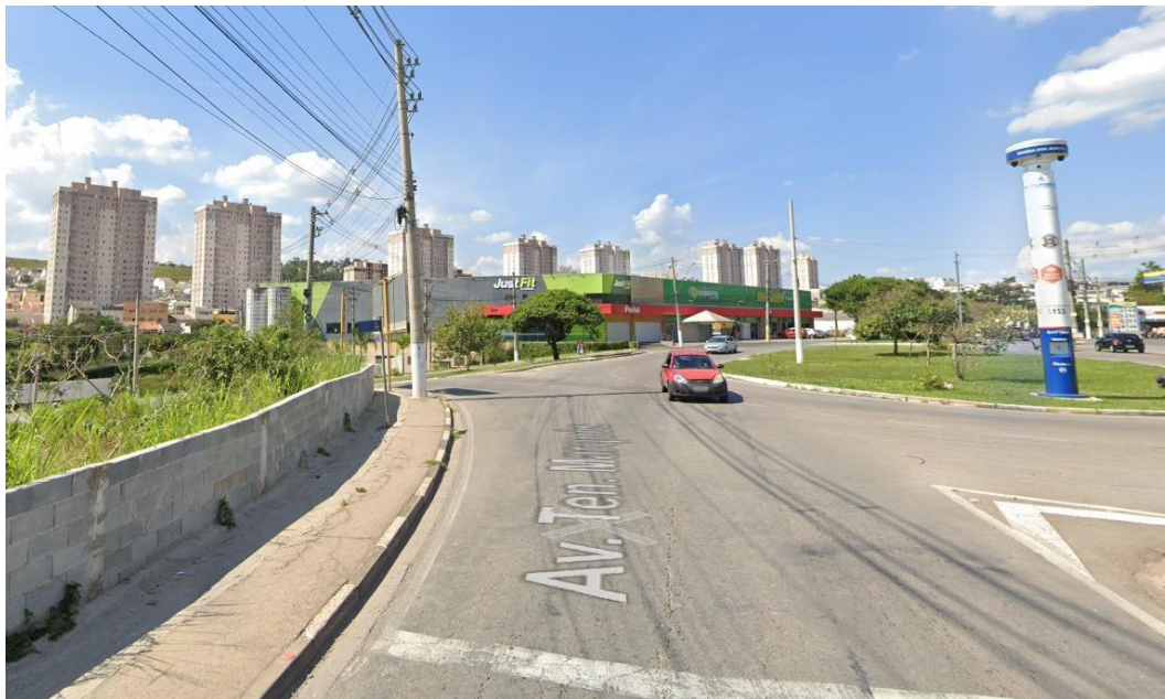
Figura 3 – Características da Av. Tenente Marques – Rotatória sentido Rua José Marques Ribeiro