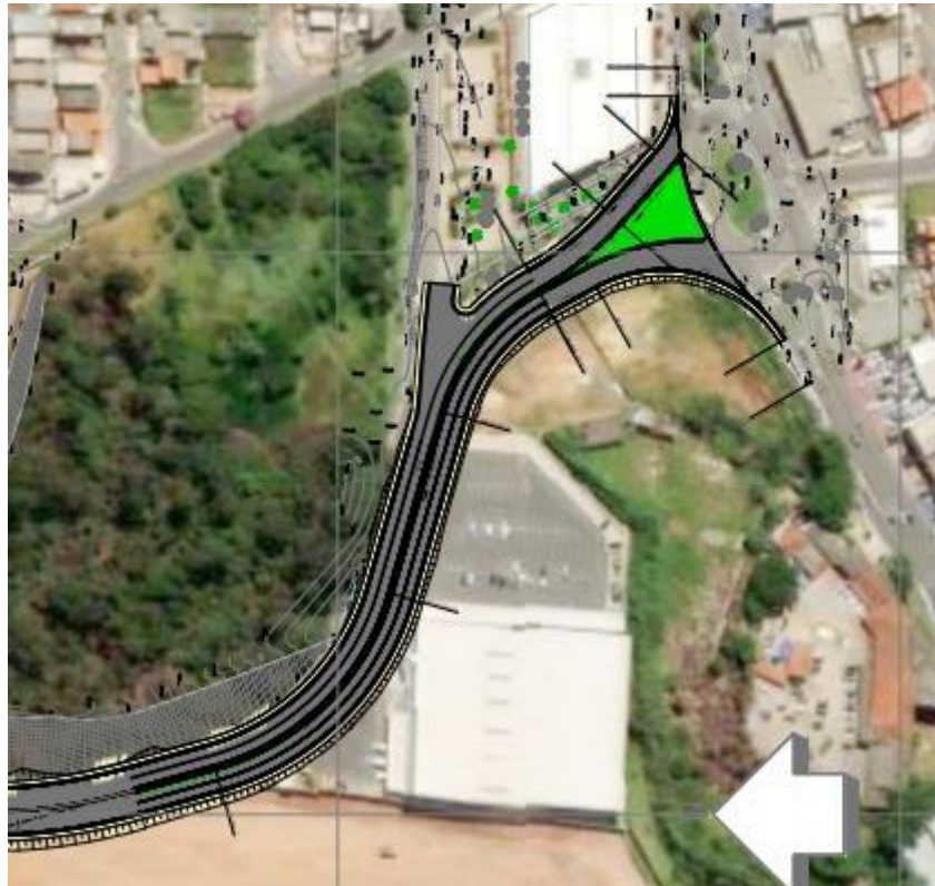
Figura 7 – Características da duplicação Rua José Marques Ribeiro